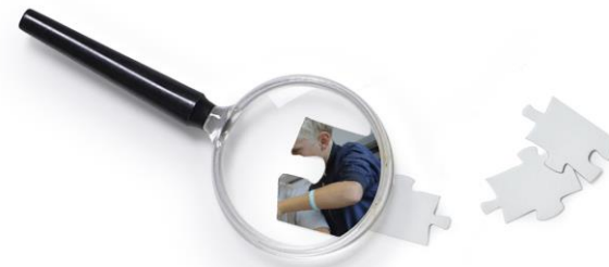
SPECIALUNDERVISNINGSELEVER ENKELTINTEGREREDE I NORMALKLASSER (DANMARKS STATISTIK OG BUVM STATISTIK)

... at 91% af frie og private grundskoler har undervisere og vejledere, der er formelt uddannet til at varetage opgaver med elever med typer af særlige behov.